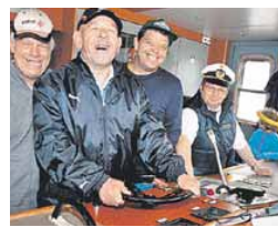
Schiff ahoi! Freudige Gesichter im Führerstand der MS Vorarlberg.