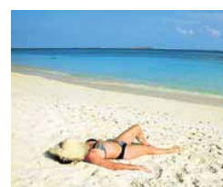
AK hilft. Ungetrübte Urlaubsfreude.

Aber auch die Weiterbildung während des Sommermonats in angenehmer Ambiente sowie ein Buchtipps der etwas anderen Art machen Lust darauf, den Urlaub auch für