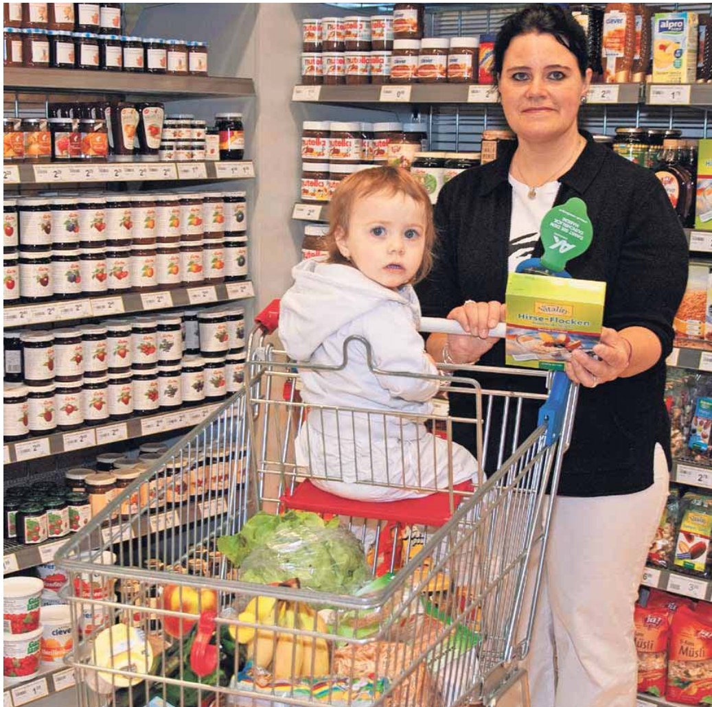
Einkaufswagenlupe. Ablaufdatum und andere Angaben sind schwerer zu „verstecken“: Rund 30 Supermärkte sind Vorreiter dieses Services.