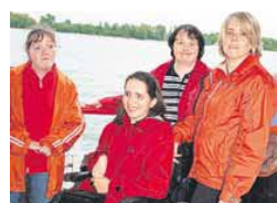
Kulisse. Vier Damen in Rot genießen die frische Brise über Deck.