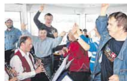
Fest. Die Stadtmusik Bregenz sorgte für ausgelassene Stimmung.

Als zu teuer sieht die OECD die überbetriebliche Lehrlingsausbildung für Jugendliche. Sie vermindere auch den Anreiz für Arbeitgeber selbst auszubilden. Die Mittel sollten reduziert und in die Förderung regulärer Ausbildungsverhältnisse umgeleitet werden, empfiehlt die OECD in ihrer neuen Studie „Länderstudie berufliche Bildung Österreich“.